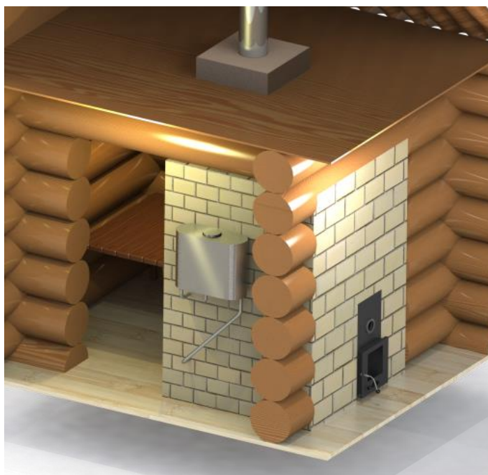
Рис.3 Противопожарный переход

Если расстояние между верхней частью аппарата и потолком составляет, как минимум, 1200 мм, то специальной защиты для потолка не требуется. Если это расстояние меньше 1200 мм, вы можете выбрать один из методов защиты. Защита потолка должна быть выполнена над поверхностью аппарата. При переходе через потолочное перекрытие необходимо установить противопожарный переход (см. рис.3).