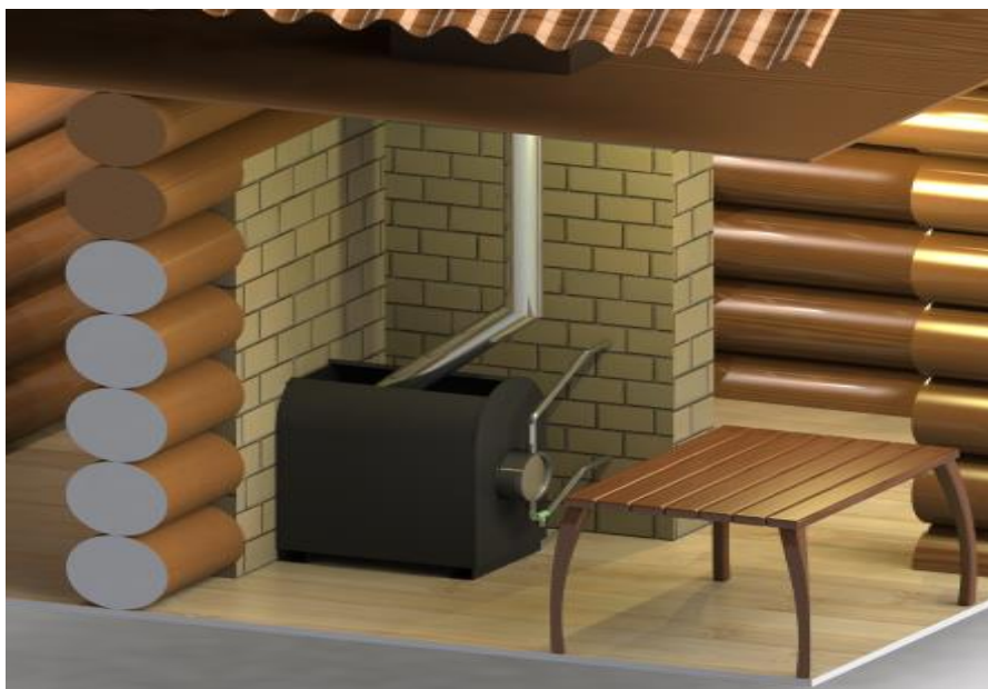
Рис.2 Печь с дистанционным нагревом воды.

Встроенный в печь универсальный регистр-теплообменник позволяет разместить бак для нагрева воды в смежном с парной помещении.